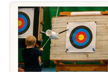
Mit viel Schwung ...